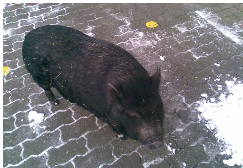
Kociánský pašík

Mgr. Petr Koubek Národní ústav pro vzdělávání, Praha