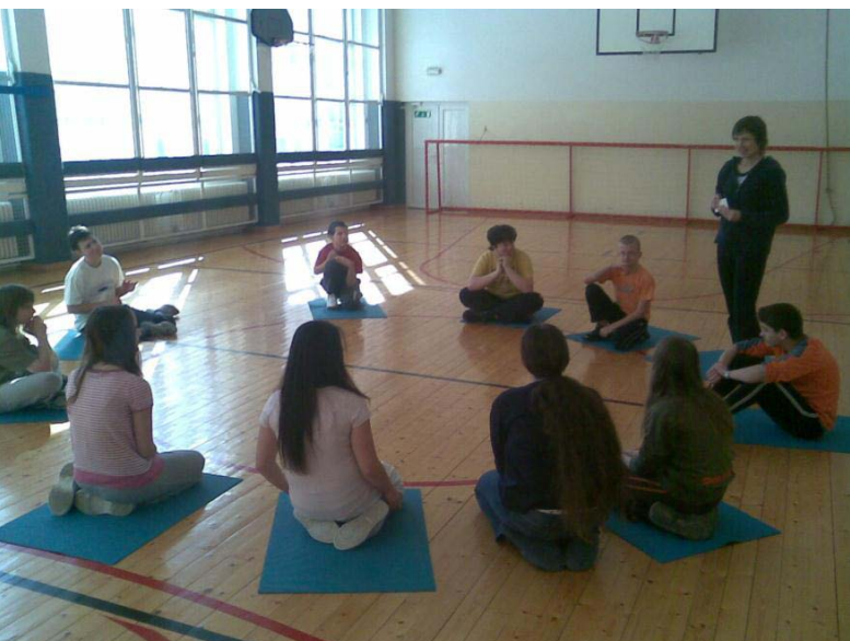
Tělesná výchova na Základní škole a Mateřské škole pro zrakově postižené a vady řeči v Plzni s využitím dramatické výchovy – „Proti-klady – předvádění emocí a jejich změny“

vhodný nástroj učení, fixace informací a utváření kompetencí. Pamatuji si jen jednu rozpačtější reakci žáků, kterou jsme s učitelem reflektovali jako zapříčiněnou přílišnou náročností, abstraktností zvoleného odborného textu v opoře.