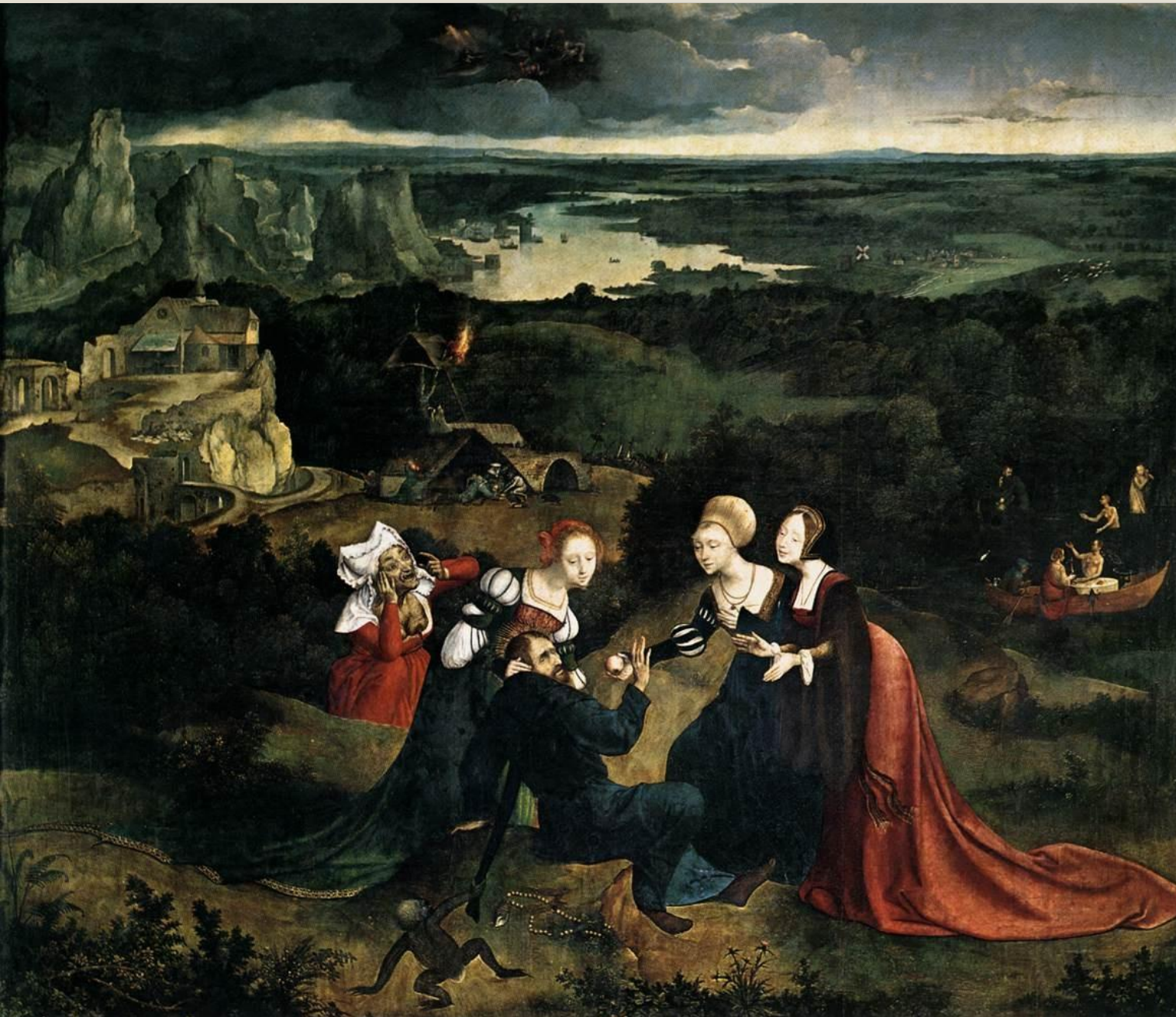
Joachim Patinir – Pokušení sv. Antonína. Wikipedia