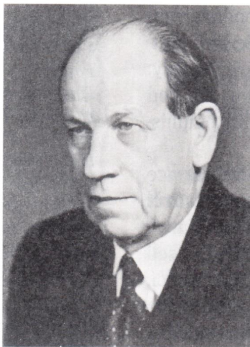
Antonín Zápotocký (1953–57).