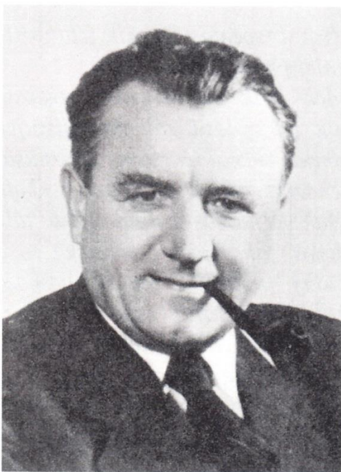
Klement Gottwald (1948–53).