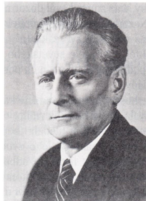
Antonín Novotný (1957–68).