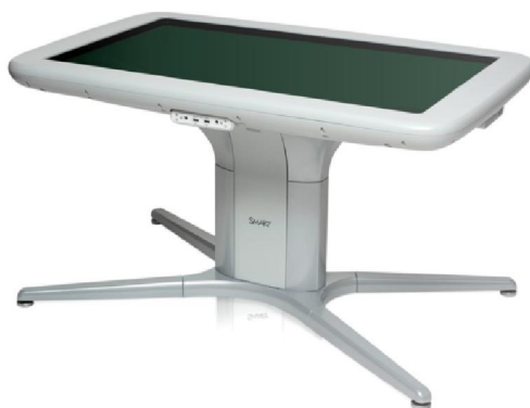
Obr. 4 – SMART table

Interaktivní stůl podporuje rozvoj spolupráce a komunikace žáků. Je vhodný pro žáky v mateřské škole a na 1. stupni základní školy.