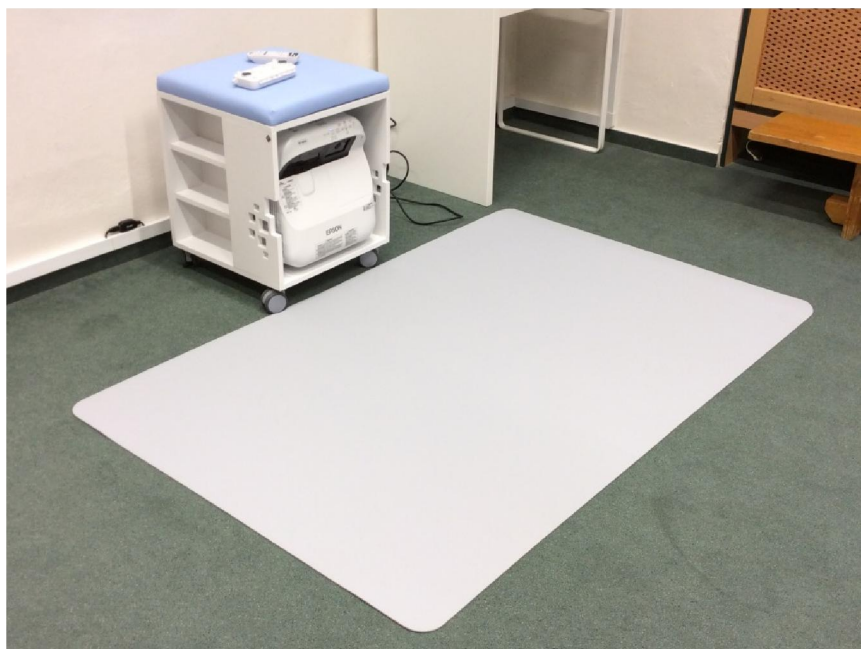
Obr. 5 – SMART cube

SMART cube je interaktivní podlaha, která promítá pomocí interaktivního projektoru obraz na podlahu nebo na speciální podložku. Žáci ovládají objekty pomocí dvou interaktivních per. Interaktivní koberec je určen pro žáky mateřských škol a 1. stupně základní školy.