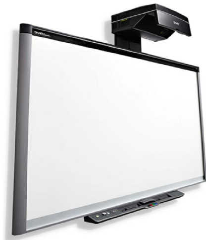
Obr. 2 – Interaktivní tabule SMART se zadní projekcí

Interaktivní tabule SMART funguje na základě propojení dotykové tabule, datového projektoru a počítače. Tabule se ovládá pomocí ruky, nebo přiložených fixů. Ovládání pomocí myši je taktéž možné, ale tím ztrácí efektivnost využití smysl. Když bych chtěla psát na interaktivní tabuli tak, jako na klasické, stačí vzít z přihrádky jakýkoliv fix a psát. Na tabuli se automaticky otevře prázdný dokument, čistá strana, která je hned připravena jako klasická tabule. Uživatel si též může vybrat barvu. Na výběr je červená, zelená, modrá a černá. Jednotlivé přihrádky jsou označeny taktéž barevně. Důležité je, z jak barevné přihrádky se fix vytáhne, ne jakou má fix barvu. Dále ve spodní přihrádce je guma na mazání. Tabule se využívá naprosto intuitivně. V současné době dotykových telefonů a tabletů není pro uživatele problém s takovou tabulí pracovat.