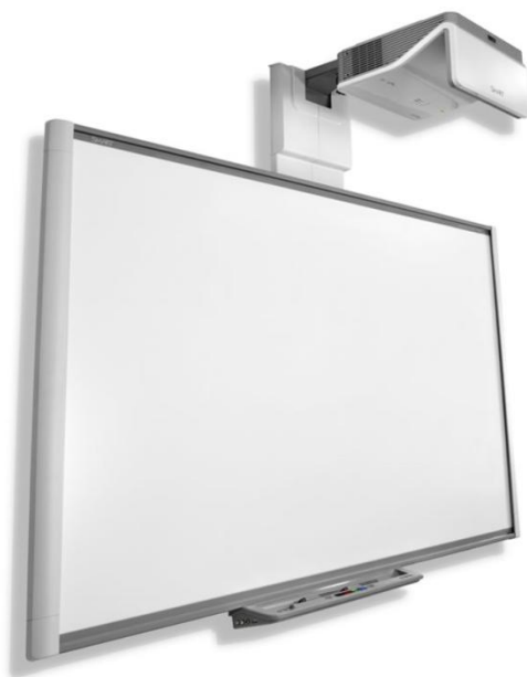
Obr. 3 – Interaktivní tabule SMART