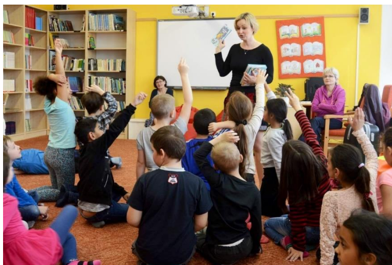
Ilustrační fotografie: ZŠ a MŠ Hranice Struhlovsko